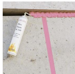
Wypełnij szczelinę pianą Piro Foam PF 240 poziomą szczelinę dylatacyjną