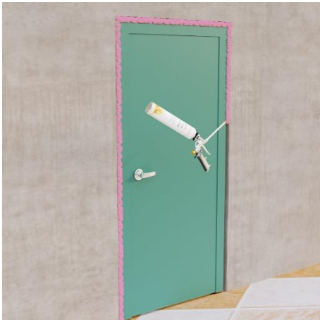
Wypełnij przestrzeń między ościeżnicą a ścianą za pomocą pianki Piro Foam PF 240