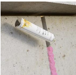
Wypełnij szczelinę pianą Piro Foam PF 240 pionową szczelinę dylatacyjną