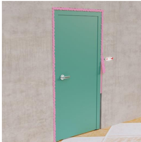
Obetnij nożykiem wystające pozostałości pianki Piro Foam PF 240