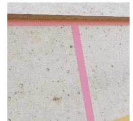
Widok prawidłowo zabezpieczonej dylatacji poziomej i pionowej w ścianie

Więcej informacji dotyczących zastosowań i instrukcji aplikacji można znaleźć pod adresem: