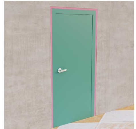
Widok prawidłowo zabezpieczonej szczeliny pomiędzy ościeżnicą drzwi a przegrodą