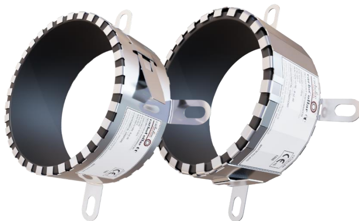
OBUDOWA CIĄGŁA 60